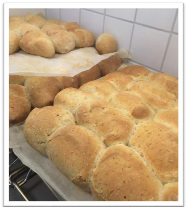
"Hjemmebakte rundstykker hver fredag er for mange et høydepunkt"

Vi har egen kantine i 2. etasje hvor alle spiser sammen. Vi har lagt opp til at barna kan spise når de selv vil. Derfor åpner kjøkkenet klokken 14.00 og stenger ca. 15.30. På den måten slipper barna å bryte opp lek eller aktiviteter for å gå og spise. Alle de voksne er flinke til å minne elevene om å gå og spise. Hvis det er noen elever som ikke spiser på AKS over tid vil vi ta kontakt med hjemmene. I starten vil 1. trinn spise og gjøre aktiviteter sammen til fastsatte tider.