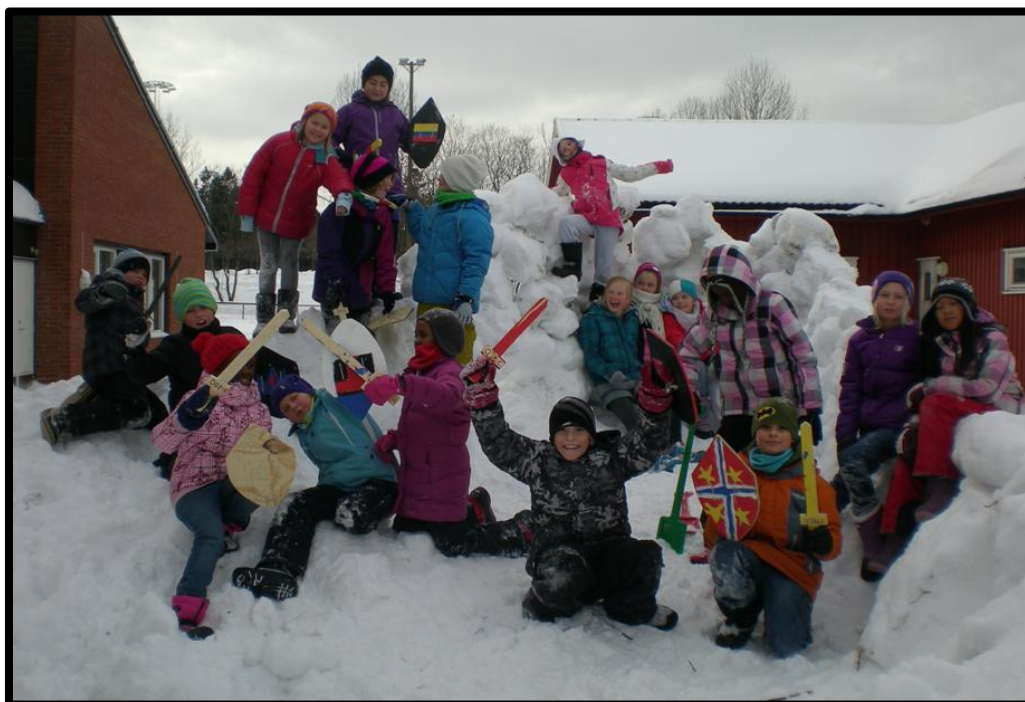
"Ridderuke med selvlagde sverd og skjold er moro"

Vi skal hjelpe deg med å utvikle din sosiale kompetanse. Det vil blant annet si hvordan man oppfører seg mot andre, hvordan man snakker til hverandre og hvordan man har forskjellige roller i forskjellige situasjoner. Dette kan for eksempel være hvordan man kommer inn i lek, hvordan man er en god vinner (og taper) og mye mer.