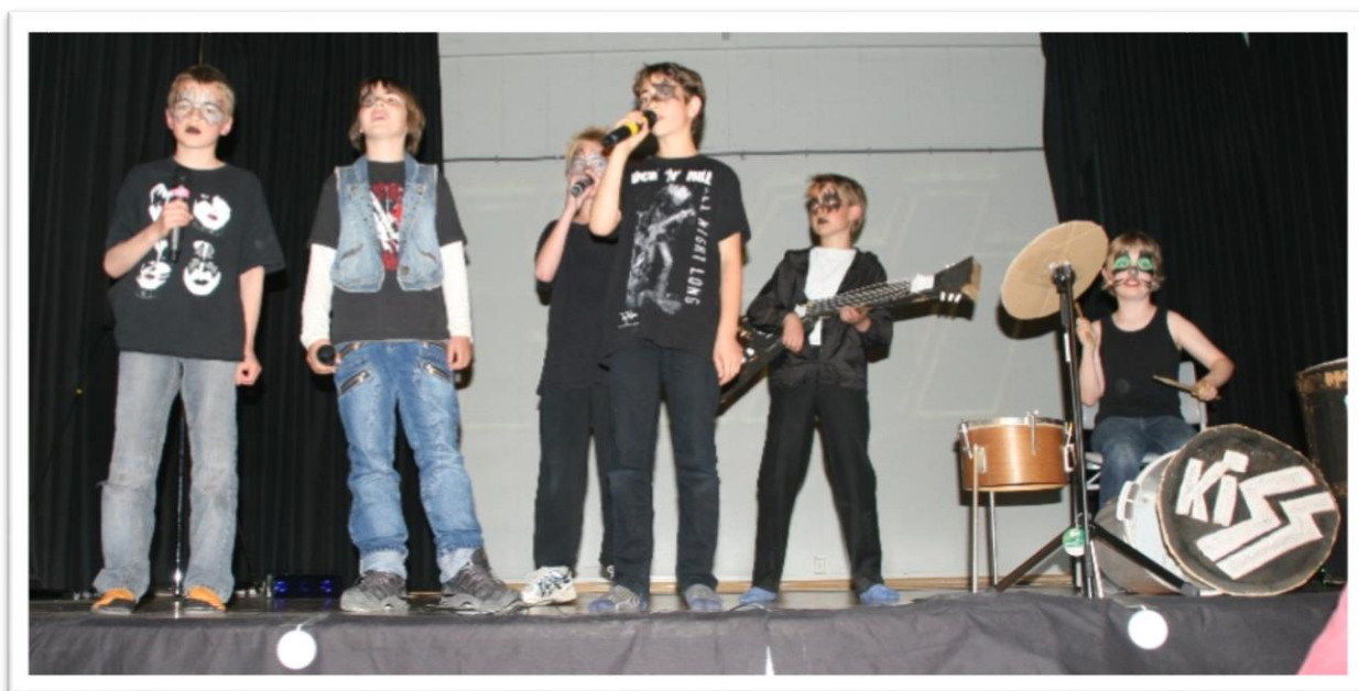
"På AKS kan man også være rockestjerner"

Dette skoleåret vil det være fire baseledere, ca. 25 barneveiledere og en kokk, i tillegg til en AKS-leder, som kommer til å gjøre alt vi kan for at du vil trives og lære masse.