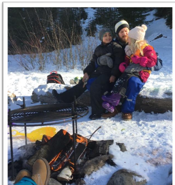
"Bål og et fang å sitte på gjør turen komplett"

Vi har fast turdag, en dag hver uke, for 1. trinn. De forskjellige klassene ruller på hvem som går på tur og hvem som er igjen på basen. Vi går til faste tursteder i nærområdet hvor vi har forskjellige aktiviteter, lager mat og koser oss.