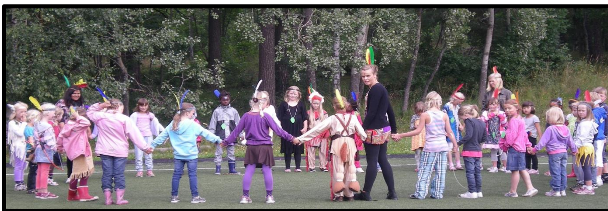
"Det er gøy med indianerdag i sommerferien"

Videre i dette heftet vil du blant annet finne informasjon om rutiner, dagene i august og kontaktinformasjon. Hvis det er noe du lurer på som du ikke finner svar på i heftet er det bare å ta kontakt med oss, så skal vi prøve å svare deg så godt vi kan.